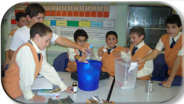
(Ara l-artiklu fuq paġna 14)