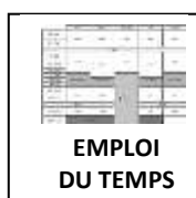
EMPLOI DU TEMPS